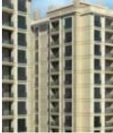
Gonca Sitesi Konut Projesi'nde 320 bin TL'ye!