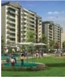
Dayı Mimarlık Mavişehir'de 372 bin TL'ye!